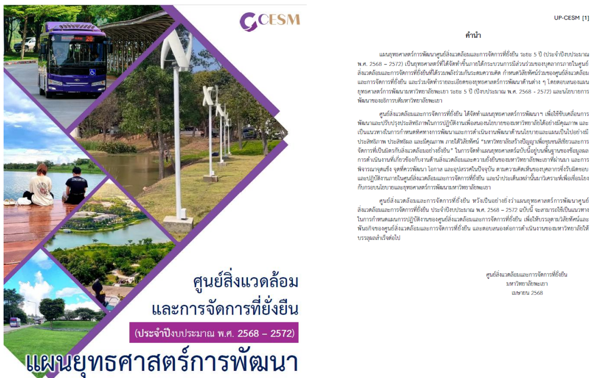
ภาพที่ 5 แผนกลยุทธ์การพัฒนาศูนย์สิ่งแวดล้อมและการจัดการที่ยั่งยืน ประจำปี พ.ศ. 2568 - 2572

ประกาศใช้ผ่านเว็บไซต์ของศูนย์สิ่งแวดล้อมและการจัดการที่ยั่งยืน www.cesm.up.ac.th โดยผ่านความเห็นชอบแผนกลยุทธ์การพัฒนาศูนย์สิ่งแวดล้อมและการจัดการที่ยั่งยืน ประจำปี พ.ศ. 2568 - 2572 (ระยะ 5 ปี) ในการประชุมประจำเดือนศูนย์สิ่งแวดล้อมและการจัดการที่ยั่งยืน ครั้งที่ 1 (1/2568) ในวันจันทร์ที่ 31 มีนาคม พ.ศ. 2568 เวลา 13.30 น. ณ ห้องประชุมศูนย์สิ่งแวดล้อมและการจัดการที่ยั่งยืน