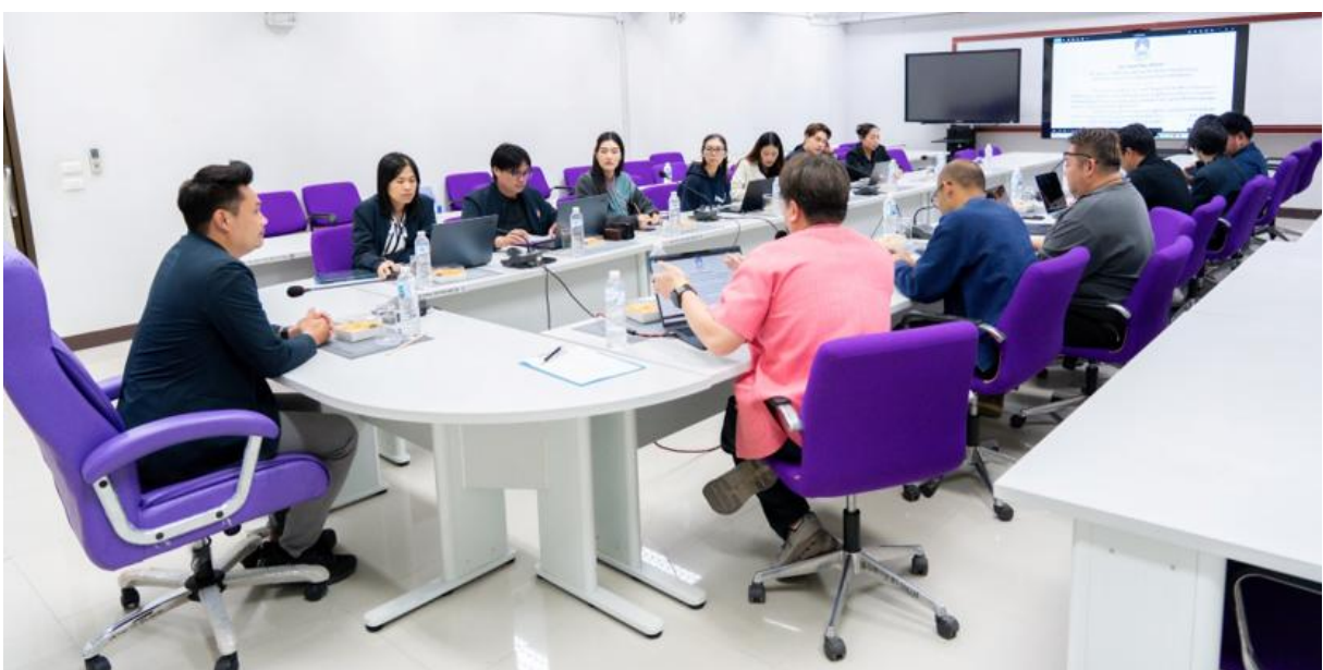
ภาพที่ 7 การประชุมประจำเดือนศูนย์สิ่งแวดล้อมและการจัดการที่ยั่งยืน ครั้งที่ 1 (1/2569)

กระบวนการที่ 4 [กุมภาพันธ์ - มีนาคม 2569] จัดทำ (ร่าง) แผนกลยุทธ์การพัฒนาศูนย์สิ่งแวดล้อมและการจัดการที่ยั่งยืน ประจำปี พ.ศ. 2569 - 2573 (ระยะ 5 ปี) โดยพิจารณาจากผลในกระบวนการที่ 3 และความสอดคล้องแผนยุทธศาสตร์การพัฒนามหาวิทยาลัยพะเยา ประจำปี พ.ศ. 2569 - 2573 ร่วมกับเสนอรับฟังข้อคิดเห็นจากบุคลากรศูนย์สิ่งแวดล้อมและการจัดการที่ยั่งยืนในการประชุมพิจารณาร่างแผนกลยุทธ์ฯ ในการประชุมประจำเดือนศูนย์สิ่งแวดล้อมและการจัดการที่ยั่งยืน ครั้งที่ 1 (1/2569) ในวันศุกร์ที่ 13 มีนาคม พ.ศ. 2569 เวลา 09.00 น. ณ ห้องประชุม กรอ. อาคารหอประชุมพญาเจ้าเมือง