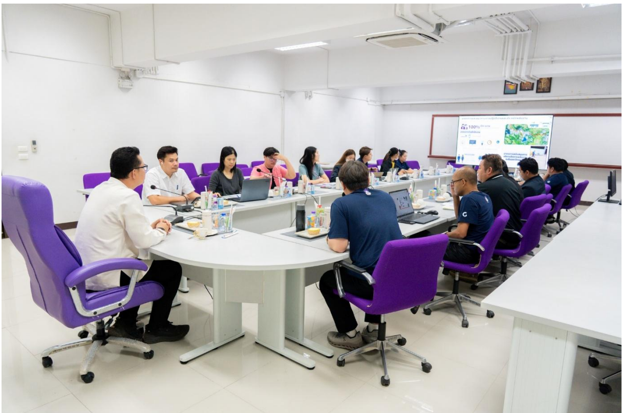
ภาพที่ 9 การประชุมประจำเดือนศูนย์สิ่งแวดล้อมและการจัดการที่ยั่งยืน ครั้งที่ 2 (2/2569)

กระบวนการที่ 6 [เมษายน 2569] ประกาศใช้แผนกลยุทธ์การพัฒนาศูนย์สิ่งแวดล้อมและการจัดการที่ยั่งยืน ประจำปี พ.ศ. 2568 - 2572 (ระยะ 5 ปี) ฉบับสมบูรณ์ ในการประชุมประจำเดือนศูนย์สิ่งแวดล้อมและการจัดการที่ยั่งยืน ครั้งที่ 2 (2/2569) ในวันศุกร์ที่ 3 เมษายน พ.ศ. 2569 เวลา 10.00 น. ณ ห้องประชุม กรอ. อาคารหอประชุมพญาภิรมย์