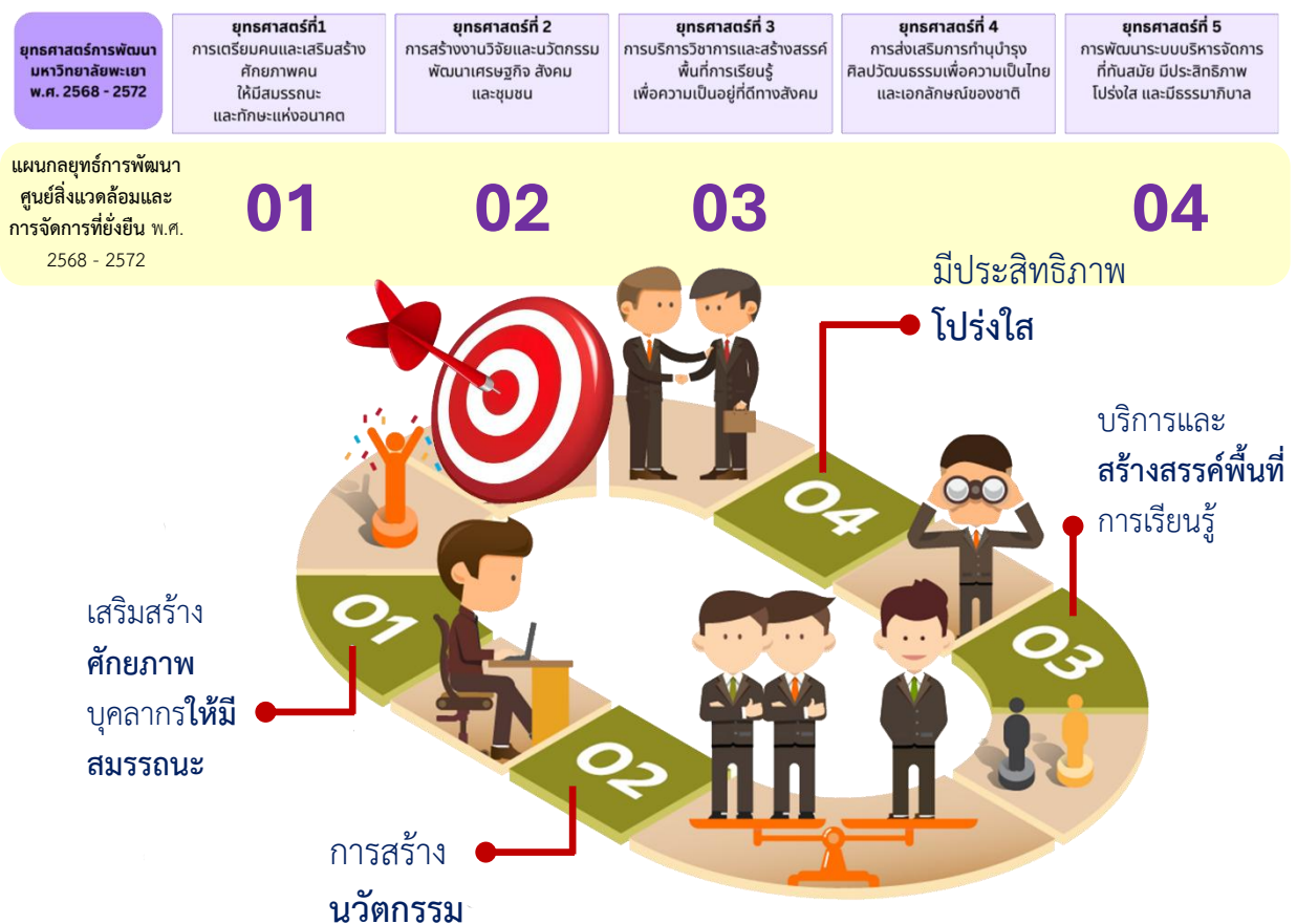
ภาพที่ 3 เป้าหมายการพัฒนาคุณยส์สิ่งแวดล้อมและการจัดการที่ยั่งยืน

เป้าหมายการพัฒนาของคุณยส์สิ่งแวดล้อมและการจัดการที่ยั่งยืน มุ่งพัฒนานวัตกรรมและสนับสนุนการเป็นมหาวิทยาลัยที่มีความเป็นกลางทางคาร์บอน ปี ค.ศ. 2050 ตามวิสัยทัศน์ของมหาวิทยาลัยพะเยา “ปัญญาเพื่อนวัตกรรมชุมชนท้องถิ่นสู่สากลอย่างยั่งยืน” รวมถึงการใช้องค์ความรู้เชิงลึกเพื่อพัฒนาเศรษฐกิจแบบองค์รวม 3 มิติ (BCG Model) มาประยุกต์ใช้ในการพัฒนาคุณยส์สิ่งแวดล้อมและการจัดการที่ยั่งยืน ได้แก่ เศรษฐกิจชีวภาพ (Bio Economy) เศรษฐกิจหมุนเวียน (Circular Economy) เศรษฐกิจสีเขียว (Green Economy) ซึ่งจะตอบโจทย์ SDGs องค์รวมของมหาวิทยาลัยพะเยา ประกอบกับเป้าหมายบรรลุตัวชี้วัดหลักของแผนยุทธศาสตร์การพัฒนามหาวิทยาลัยพะเยา ระยะ 5 ปี ที่ว่าพัฒนากายภาพและสิ่งแวดล้อมสู่การเป็นมหาวิทยาลัยสีเขียวระดับโลก (World Green University) และเป็นต้นแบบในการสร้างความยั่งยืน ดังแผนภูมิต่อไปนี้