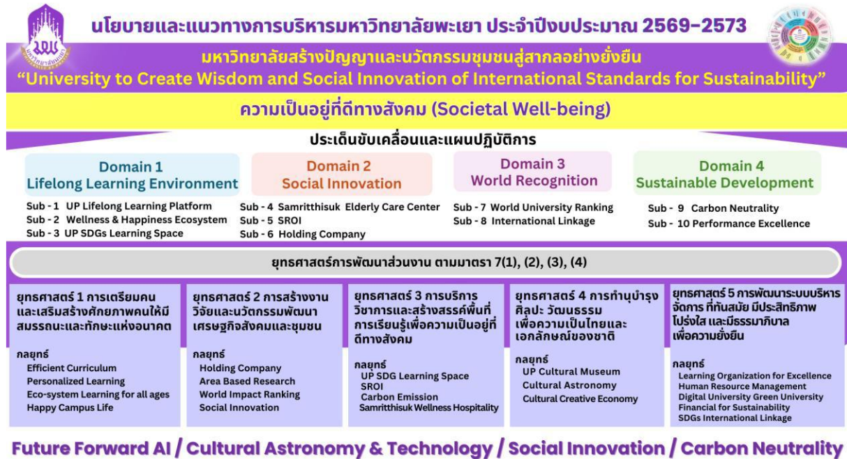
ภาพที่ 4 แนวคิดในการกำหนดแผนยุทธศาสตร์การพัฒนามหาวิทยาลัยพะเยา ประจำปีงบประมาณ พ.ศ. 2569 - 2573

แนวคิดในการกำหนดแผนยุทธศาสตร์การพัฒนามหาวิทยาลัยพะเยา ประจำปีงบประมาณ พ.ศ. 2569 – 2573