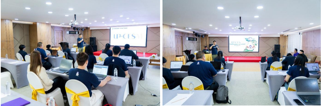
ภาพที่ 8 โครงการอบรมสัมมนาปรับปรุงแผนกลยุทธ์และพัฒนาบุคลากร ประจำปีงบประมาณ 2569

กระบวนการที่ 5 [มีนาคม 2569] ขอความเห็นชอบแผนกลยุทธ์การพัฒนาศูนย์สิ่งแวดล้อมและการจัดการที่ยั่งยืน ประจำปี พ.ศ. 2569 - 2573 (ระยะ 5 ปี) ในโครงการอบรมสัมมนาปรับปรุงแผนกลยุทธ์และพัฒนาบุคลากร ประจำปีงบประมาณ 2569 ในวันพฤหัสบดีที่ 19 มีนาคม พ.ศ. 2569 57 ถึงวันศุกร์ที่ 20 มีนาคม พ.ศ. 2569 ณ โรงแรม เบย์ บีช รีสอร์ทท จอมเทียน จังหวัดชลบุรี