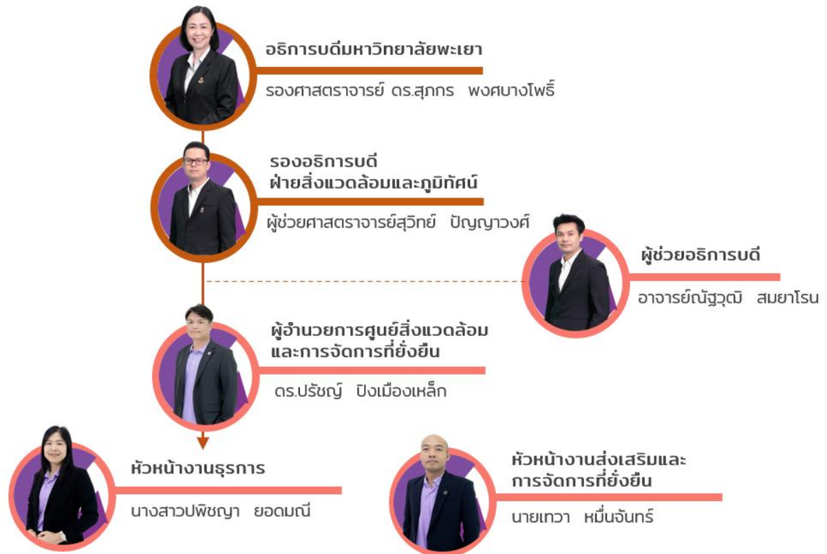
ภาพที่ 2 แผนผังผู้บริหารของศูนย์สิ่งแวดล้อมและการจัดการที่ยั่งยืน