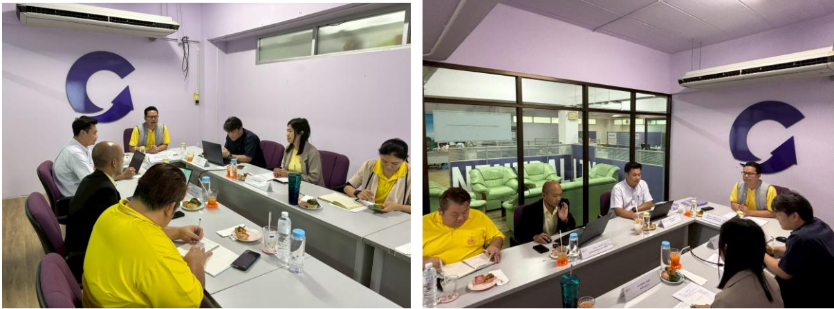
ภาพที่ 6 การประชุมประจำเดือนศูนย์สิ่งแวดล้อมและการจัดการที่ยั่งยืน ครั้งที่ 1 (1/2568)

กระบวนการที่ 2 [พฤศจิกายน 2568] วิเคราะห์แผนยุทธศาสตร์การพัฒนามหาวิทยาลัยพะเยา ประจำปี พ.ศ. 2569 - 2573 และเป้าหมายเชิงกลยุทธ์ เพื่อให้หน่วยงาน/ส่วนงาน นำไปปรับปรุงและจัดทำแผนกลยุทธ์การพัฒนาศูนย์สิ่งแวดล้อมและการจัดการที่ยั่งยืน ประจำปี พ.ศ. 2568 - 2572