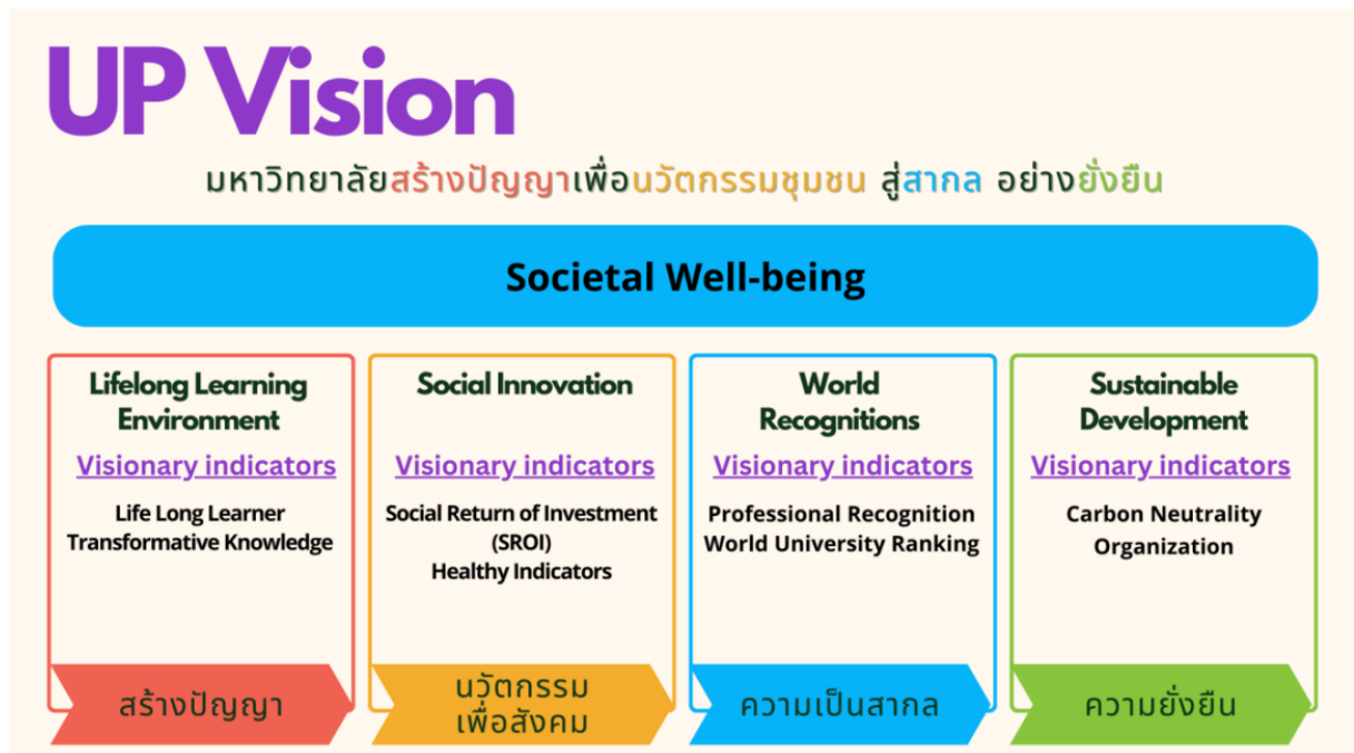
ภาพที่ 4 แนวคิดในการกำหนดแผนยุทธศาสตร์การพัฒนามหาวิทยาลัยพะเยา ประจำปีงบประมาณ พ.ศ. 2568 - 2572

แนวคิดในการกำหนดแผนยุทธศาสตร์การพัฒนามหาวิทยาลัยพะเยา ประจำปีงบประมาณ พ.ศ. 2568 - 2572