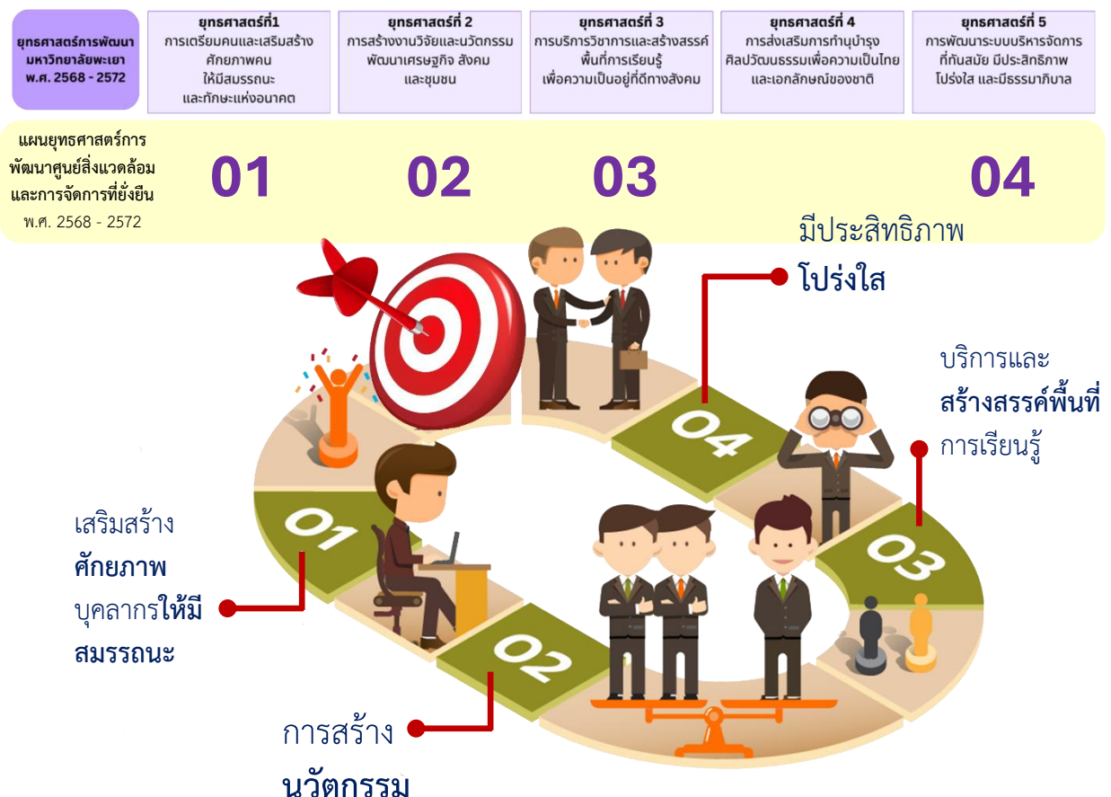
ภาพที่ 3 เป้าหมายการพัฒนาสู่สิ่งแวดล้อมและการจัดการที่ยั่งยืน

เป้าหมายการพัฒนาของศูนย์สิ่งแวดล้อมและการจัดการที่ยั่งยืน มุ่งพัฒนานวัตกรรมและสนับสนุนการเป็นมหาวิทยาลัยที่มีความเป็นกลางทางคาร์บอน ปี ค.ศ. 2050 ตามวิสัยทัศน์ของมหาวิทยาลัยพะเยา “ปัญญาเพื่อนวัตกรรมชุมชนท้องถิ่นสู่สากลอย่างยั่งยืน” รวมถึงการใช้องค์ความรู้เชิงลึกเพื่อพัฒนาเศรษฐกิจแบบองค์รวม 3 มิติ (BCG Model) มาประยุกต์ใช้ในการพัฒนาสู่สิ่งแวดล้อมและการจัดการที่ยั่งยืน ได้แก่ เศรษฐกิจชีวภาพ (Bio Economy) เศรษฐกิจหมุนเวียน (Circular Economy) เศรษฐกิจสีเขียว (Green Economy) ซึ่งจะตอบโจทย์ SDGs องค์รวมของมหาวิทยาลัยพะเยา ประกอบกับเป้าหมายบรรลุตัวชี้วัดหลักของแผนยุทธศาสตร์การพัฒนามหาวิทยาลัยพะเยา ระยะ 5 ปี ที่ว่าพัฒนากายภาพและสิ่งแวดล้อมสู่การเป็นมหาวิทยาลัยสีเขียวระดับโลก (World Green University) และเป็นต้นแบบในการสร้างความยั่งยืน ดังแผนภูมิต่อไปนี้