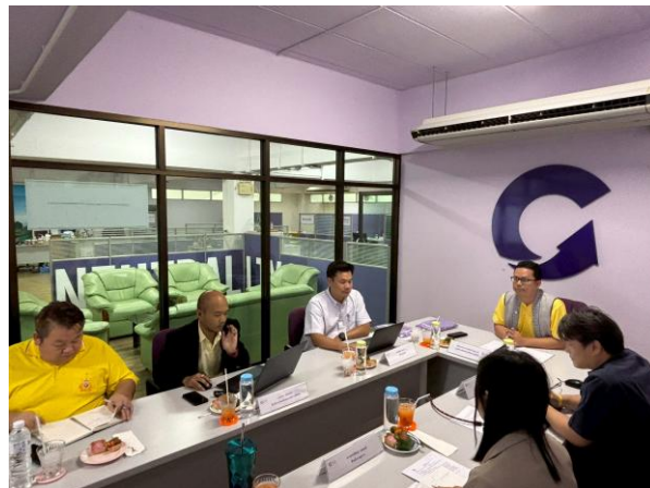
การประชุมประจำเดือนศูนย์สิ่งแวดล้อมและการจัดการที่ยั่งยืน ครั้งที่ 1 (1/2568)

กระบวนการที่ 6 [เมษายน 2568] ประกาศใช้แผนยุทธศาสตร์การพัฒนาศูนย์สิ่งแวดล้อมและการจัดการที่ยั่งยืน ประจำปี พ.ศ. 2568 - 2572 (ระยะ 5 ปี) ฉบับสมบูรณ์